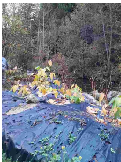
L'ancienne bâche de 2024

Malgré tout, nous avons constaté qu'un certain nombre de rhizomes n'avait pas résisté.