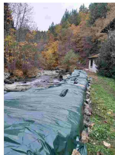
La nouvelle bâche posée 2025

En présence du propriétaire nous avons enlevé l'ancienne bâche, puis ôté les repousses de renouée, puis installé la nouvelle couverture. Ensuite il a fallu ancrer la bâche pour qu'elle résiste aux crues, disposer des sacs de sable et enfin fixer et tendre des cordes pour que le vent ne soulève pas notre protection.