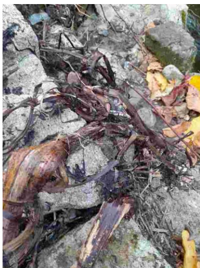
Des premiers résultats