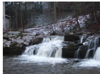
Le saut des billes

Le samedi 23 octobre, cette fois 7 bénévoles de l'AAPPMA de St Didier aidés de 5 membres de la section monistrolienne du CPSFV se sont attaqués aux ronces, fougères, genêts (les chalayes et les balayes en patois) de la micro centrale des Mazeaux à la levée soit sur environ 700 mètres en passant par le saut des billes.